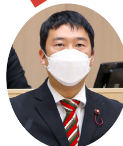
反対討論を行う 羽鳥区議