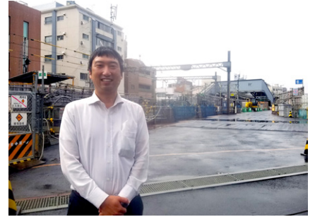
地下化工事を視察(新井薬師前駅工事ヤード)

現在行われている西武新宿線の中井駅 - 野方駅間の地下化工事の完了が7年遅れることが発表されました。当初計画からは13年遅れとなります。原因としては、用地買収の遅れ、シールドマシンの稼働時間の見直しがあります。